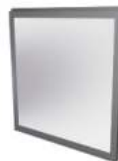
Cristal laminar 3+3 Laminated glass 3+3 Verre Laminaire 3+3