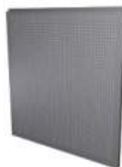
Chapa Perforada Perforated Sheet Tôle Perforée