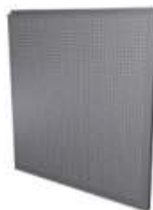
Inox Chapa Perforada Stainless Steel Perforated Sheet Inoxydable Tôle Perforée