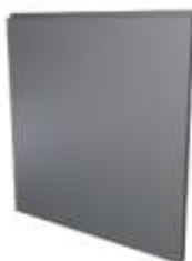
Chapa Ciega Blind Sheet Tôle Pleine